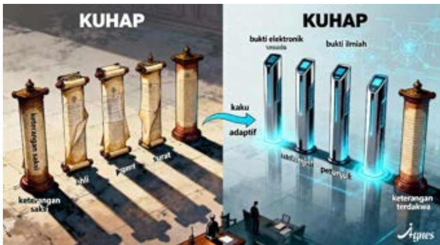
Gambar 2.1: Diagram perbandingan alat bukti sah menurut Pasal 184 KUHP lama (keterangan saksi, ahli, surat, petunjuk, keterangan terdakwa) dengan penambahan alat bukti baru dalam KUHP baru, yang secara eksplisit mencakup bukti elektronik dan bukti ilmiah, menandai evolusi dari sistem yang kaku ke sistem yang lebih adaptif terhadap teknologi.

menjamin bahwa bukti digital yang diajukan benar-benar valid, sah, dan dapat dipercaya secara hukum.