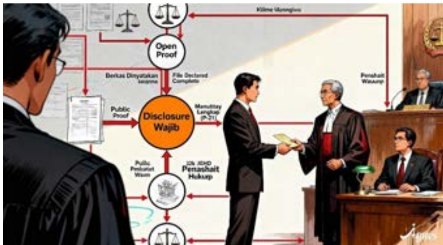
Gambar 1.2: Alur Proses Pembuktian Terbuka. Sebuah diagram alir yang menggambarkan proses dari tahap penyidikan hingga persidangan. Alur menunjukkan titik "Disclosure Wajib" setelah berkas dinyatakan lengkap (P-21), di mana Penuntut Umum menyerahkan semua bukti (memberatkan dan meringankan) kepada Penasihat Hukum. Alur kemudian bercabang menunjukkan kemungkinan strategi pembelaan yang lebih terinformasi.

menyembunyikan bukti, terutama bukti yang meringankan. Tanpa mekanisme yang kuat, prinsip keterbukaan ini hanya akan menjadi macan kertas.